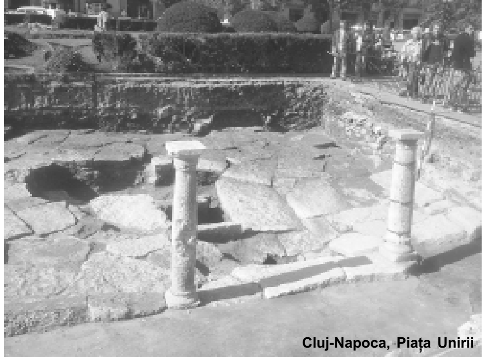
Cluj-Napoca, Piața Unirii

După câte am avut a constata, poziția mea nu a avut ecou, nu s-a făcut nimic pozitiv și nu sînt convinsă că ne dăm suficient de bine seama ce