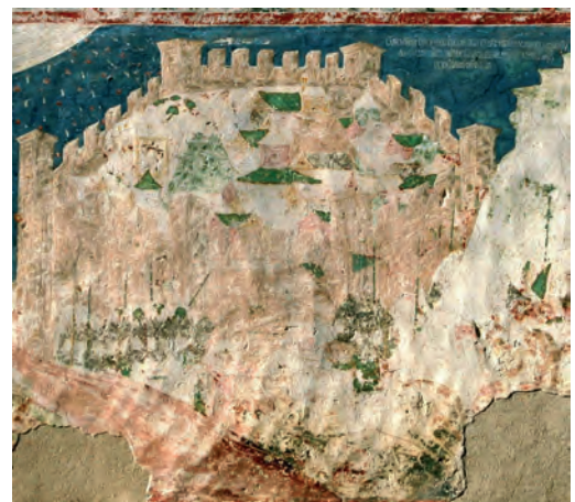
Fig. 8. Imnul Acatist, Asediul Constantinopolului.