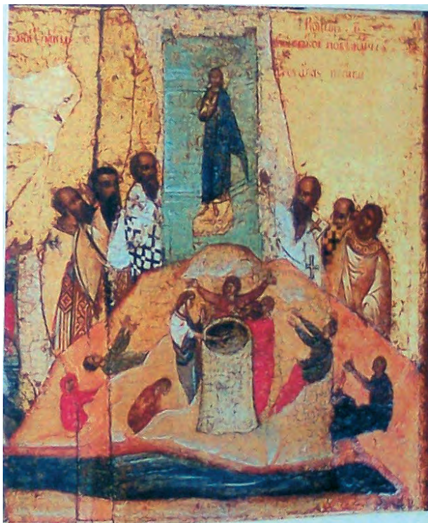
Fig. 3. Icoana Uspenski, detaliu.