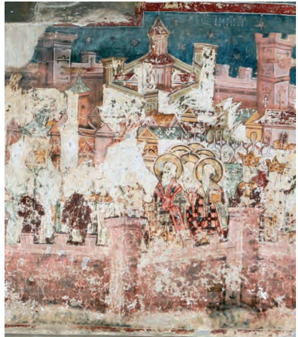
Fig. 6. Imnul Acatist, Asediul Constantinopolului.