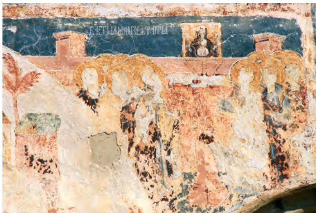
Fig. 9. Imnul Acatist, Asediul Constantinopolului.

în 717, sub Leon Isaurul. 9 Deși la asediul din 626 icoana scoasă de Constantin, fiul lui Heraclius și de patriarhul Serghie să apere fortificațiile, fusese cea a Fecioarei din biserica Vlachelnelor 10 – orantă cu Pruncul în medalion, pe piept, așa cum apare descrisă în secolul al XI-lea 11 – memoria narațiunilor Asediilor a reținut tipul Hodighitriei, 12 menționat expres în atacul din 717 13 cu referință la icoana mănăstirii τῶν Ὁδηγῶν, transmis și în pictura murală din monumentele Moldovei.