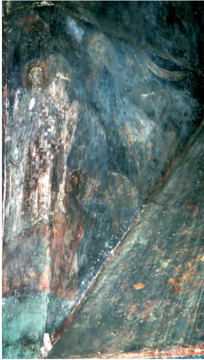
Fig. 1. Părhăuți.