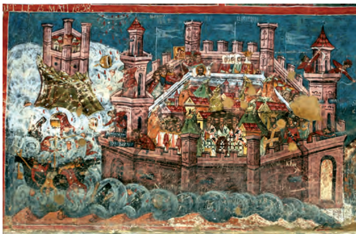
Fig. 7. Vlacherne, Arta, Procesiunea icoanei Hodighitria pe străzile Constantinopolului.