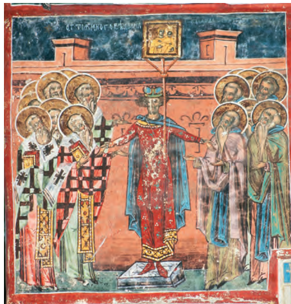
Fig. 4. Humor, Imnul Acatist, strofa 17.

care o susține pe hampă, extinzând-și brațele ca și cum ar fi crucificat. Gestul recheamă relatările pelerinilor ruși (Ștefan din Novgorod, spre 1350) despre slujba de marți destinată acestei icoane, palladium al Constantinopolului, în mănăstirea Maicii Domnului Hodighitria / τῶν Ὁδηγῶν : „se scoate această icoană în fiecare marți ... se așează ... pe umerii unui singur om și el își întinde brațele ca și cum ar fi răstignit ...”. 5 Ridicarea Hodighitriei în procesiune și purtarea ei pe străzile capitalei de „omul răstignit” apare în reprezentarea hapax de la sfârșitul secolului al XIII-lea, din narthexul bisericii Vlacherne, lângă Arta 6 (Fig. 5). La Humor, din memoria procesiunii de marți a mănăstirii Hodighitriei s-a păstrat fragmentul purtătorului de icoană, care se asociază unui topos al cinstirii imaginii.