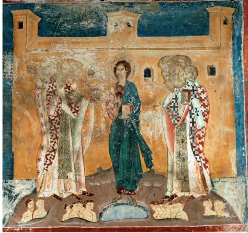
Fig. 2. Arbore.

Sursa celor două reprezentări stă în ilustrarea scenei corespondente din icoana bizantină aflată la Moscova (Fig. 3), a cărei descifrare a fost făcută pe baza relatărilor pelerinilor ruși din secolele XIV-XV, la Constantinopol: 2 este minunea care se petrecea la mănăstirea Hristos Philanthropos din Vechiul Serai, unde se arătase Hristos / era o icoană achiropiită a lui Hristos în picioare, și unde, lângă mare, curgea o apă sfântă izvorând de sub biserică, vindecătoare, împreună cu nisipul din jur, de lepră și de multe alte boli. 3 Deși în monumentele din Moldova „zidul” pe care este proiectată figura lui Hristos a dispărut, „fundamentele” vindecării sunt prezente. Dacă însă versiunea de la Părhăuți e foarte aproape de cea a icoanei Uspenski, la Arbore, detaliul, inexistent în rapoartele călătorilor ruși, al îngropării bolnavilor până la gât în nisipul miraculos, are altă sursă: practica apelului la vindecare, din ziua Schimbării la Față, menținută până târziu după căderea capitalei, menționată de călătorii occidentali în secolul al XVII-lea, 4 care putea fi cunoscută din relatări consemnate sau din mărturie directă.